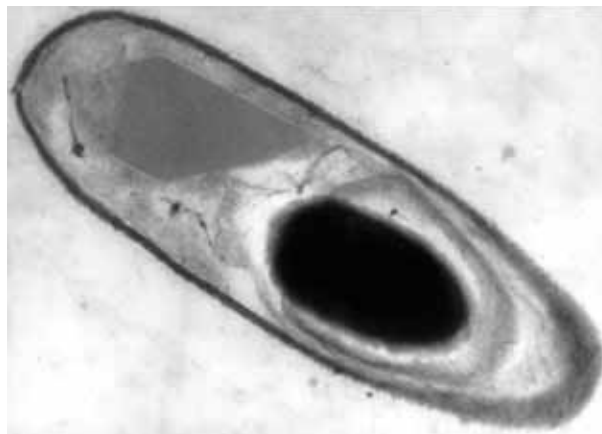
FIGURE 1: COUPE LONGITUDINALE DE BACILLUS THURINGIENSIS EN FIN DE SPORULATION. OBSERVATION PAR MICROSCOPIE ÉLECTRONIQUE. ON DISTINGUE LE CRISTAL PROTÉIQUE À PROPRIÉTÉS INSECTICIDES (INCLUSION PARASPORALE DE FORME BIPYRAMIDALE) ET LA SPORE (FORME OVOÏDE NOIRE)

Aujourd'hui, Bt occupe 50 % du marché mondial des bios insecticides microbiens, ce qui représente 3 à 4 % du marché total des insecticides. Les formulations commerciales de Bt sont constituées de préparations de spores et de cristaux obtenues à partir de cultures réalisées en fermenteurs. Ces produits n'ont pas de contraintes liées à un délai avant récolte (DAR) et se présentent généralement sous forme de poudres mouillables ou de concentrés liquides