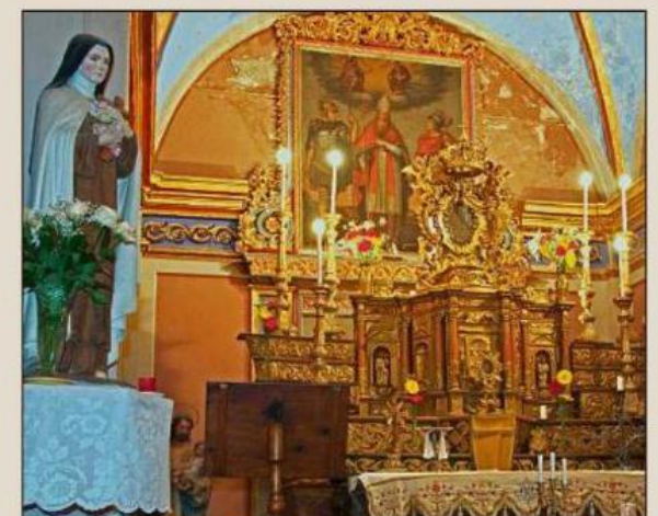
Un chœur fortement dégradé, dont les enduits, les moulures et les décors doivent être refaits.

Pourquoi Marie ? En hommage à la Madone ? Possible. Une légende locale raconte, en effet, qu'il y a fort longtemps, un ermite se serait installé sur le piton qui porte aujourd'hui le village, y bâtissant une chapelle dédiée à la Vierge Marie. La réputation du saint homme était telle qu'autour de lui vinrent se fixer quelques familles, fondant un hameau auquel ils donnèrent le nom de la mère du Christ. Ce n'est qu'une légende. Aucun document ne la valide. Lorsque le village apparaît dans les textes, en 1066, c'est déjà une communauté constituée, qui appartient aux Thorame-Glandèves, seigneurs tout puissants de la vallée. Peu importe si l'histoire et le merveilleux se fondent, se confondent. Ou pas. L'église de Marie est toujours là. Située place de la Colle, elle est le premier bâtiment que découvre le visiteur en arrivant. Premier passage ascensionnel vers le paradis puisque le bâtiment est l'un des rares à posséder un dallage pentu montant progressivement vers l'autel majeur. L'originalité du site se démultiplie grâce à deux tableaux de Giovanni Rocca, de 1644 et à une somptueuse statue poly-